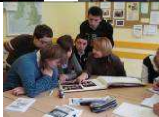
To zespół redakcyjny przy ciężkiej pracy nad numerem szkolnej gazetki „Bez tytuł”.